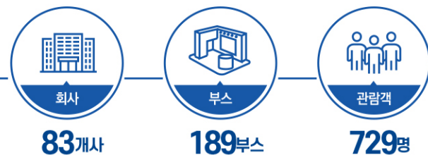
Exhibit Item 전시품목

21년도는 온라인·오프라인·Hybrid 무관중 전시회로 진행되었습니다. SPOEX LIVE 생중계 12만 명 이상소통, 팔로워 총합 150만명 이상의 인플루언서를 통한 온라인 중계